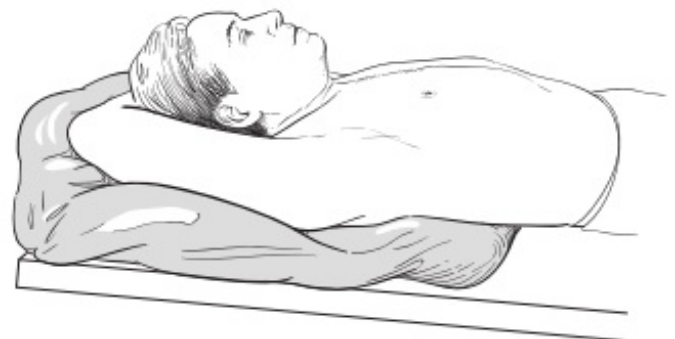
Imagem 1. Posicionamento no molde

É provável que você fique deitado de costas durante a simulação. Enquanto você está deitado na mesa, será feito um molde da parte superior de seu corpo. Os radioterapeutas derramarão um fluido morno em uma bolsa plástica grande que será lacrada e colocada sobre a mesa. Você se deitará sobre a bolsa, de costas, com os braços erguidos acima da cabeça (consulte a imagem Figura 1). O fluido vai ficar morno no início, mas esfria à medida que endurecer. Enquanto o fluido esfria, os terapeutas vão prender a bolsa com fita na sua pele para que ela fique com o formato da parte superior de seu corpo e dos braços. Esse procedimento leva cerca de 15 minutos.