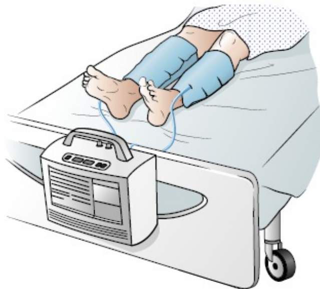
Рисунок 3. Манжеты SCD на ногах

Если вы находитесь в больнице, риск образования сгустков крови повышается. Чтобы предотвратить образование сгустков крови, можно использовать манжеты SCD.