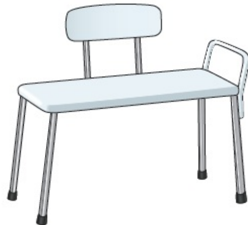
Рисунок 5. Переходная скамейка для ванны

Переходная скамейка для ванны — это сиденье, с помощью которого можно зайти в душ или ванну и выйти оттуда. Она удобна тем людям, которым может быть трудно поднимать ноги, чтобы перешагнуть через бортик ванны. На каждую ножку такой скамейки надеты резиновые колпачки или присоски (см. рисунок 5). Они обеспечивают устойчивость и легкость использования скамейки и вашу безопасность в ванне.