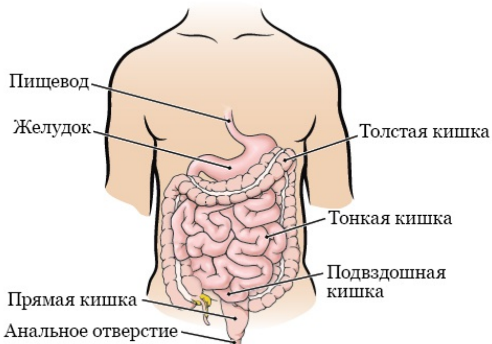
Рисунок 1. Пищеварительная система

Пережеванная и проглоченная пища попадает в пищевод. Пищевод — это длинная мышечная трубка, по которой пища проходит из рта в желудок. Поступив в желудок, пища смешивается с желудочными кислотами. Эти кислоты начинают переваривать (расщеплять) пищу.