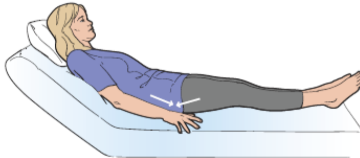
Рисунок 3. Сжатие ягодичных мышц

Выполняйте это упражнение каждый час, когда вы не спите.