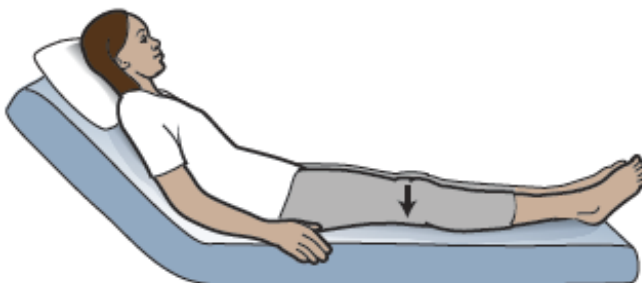
Рисунок 2. Сжатие квадрицепсов

Выполняйте это упражнение каждый час, когда вы не спите.