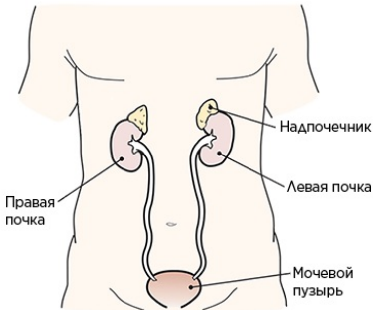
Рисунок 2. Почки и надпочечники