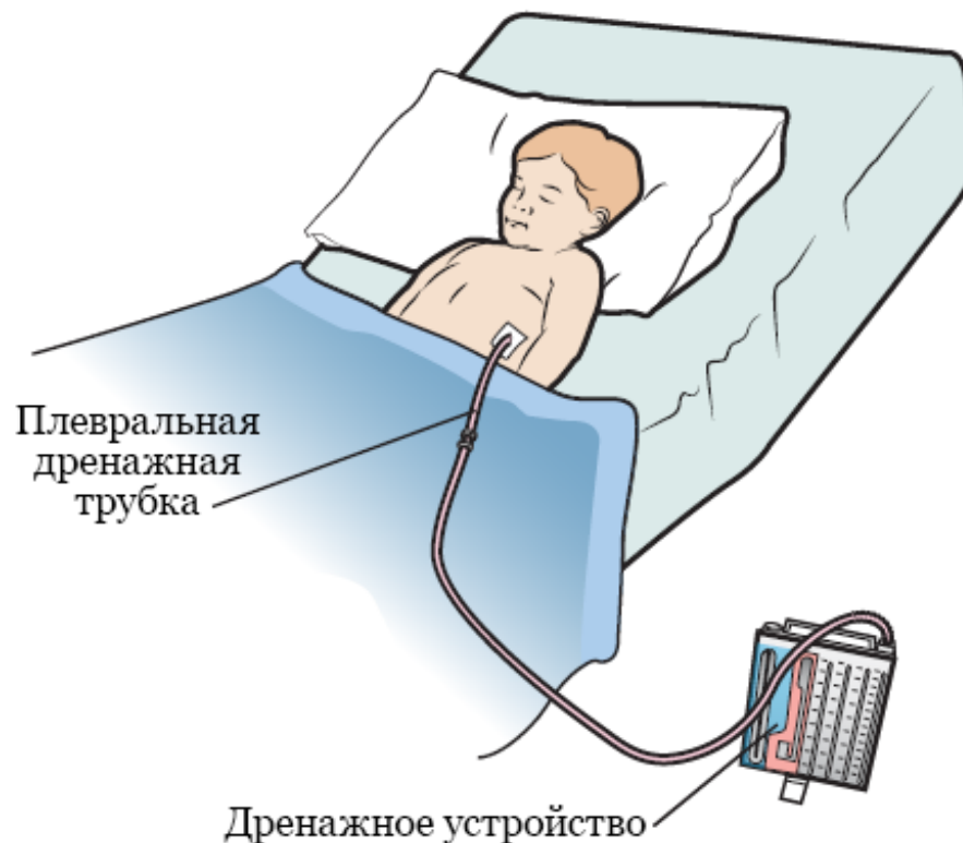
Рисунок 3. Плевральная дренажная трубка и дренажное устройство