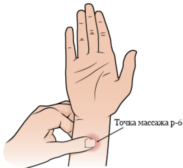
Рисунок 2. Как прижать большой палец к точке под указательным пальцем