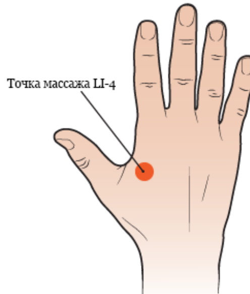
Рисунок 1. Точка массажа LI-4 на тыльной стороне ладони

на тыльной стороне ладони. Ее можно найти между основанием большого и указательного пальцев (см. рисунок 1). Массаж этой точки устраняет головную и другую боль.