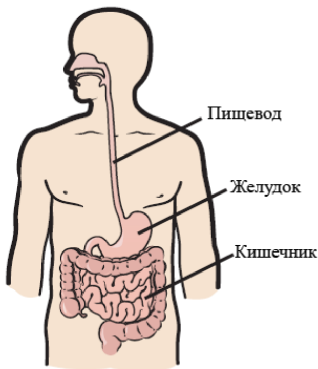
Рисунок 1. Анатомия пищеварительной системы

Наличие пищевода Барретта может повысить риск развития рака пищевода. Именно поэтому важно регулярно проходить медицинское обследование и не отклоняться от плана лечения.