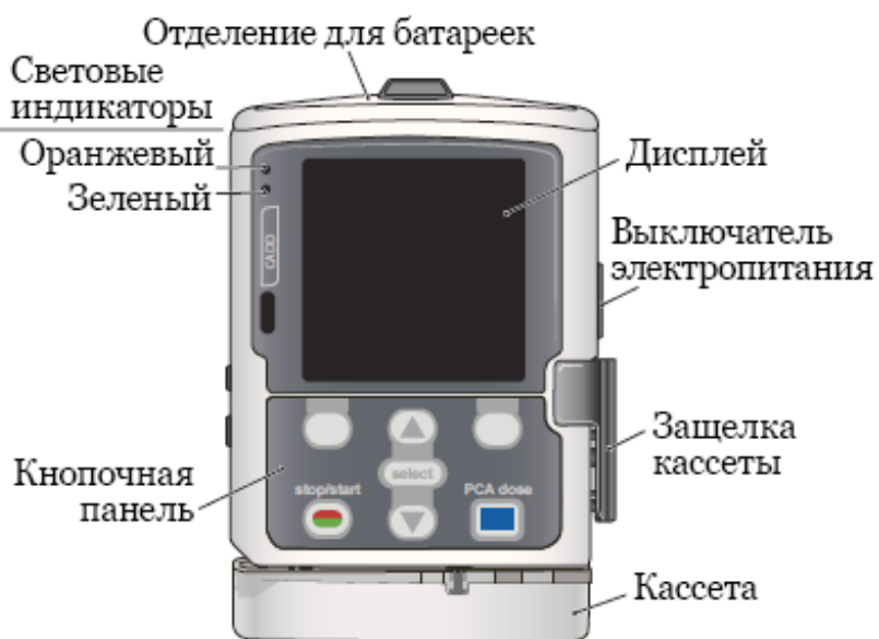
Рисунок 1. Инфузионная помпа CADD-Solis VIP

CADD-Solis VIP представляет собой небольшую помпу, работающую от аккумулятора. Ее можно использовать для внутривенного введения жидкостей, лекарств и препаратов для химиотерапии (см. рисунок 1).