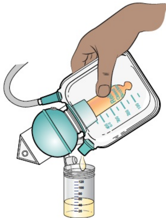
Рисунок 3. Опорожнение дренажа ReliaVac

Чтобы опорожнить контейнер для сбора, следуйте приведенным ниже инструкциям.