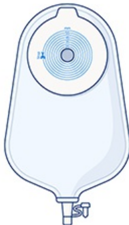
Рисунок 3. Соединение стомного мешка и клеевой пластины в однокомпонентной мочеприемной системе