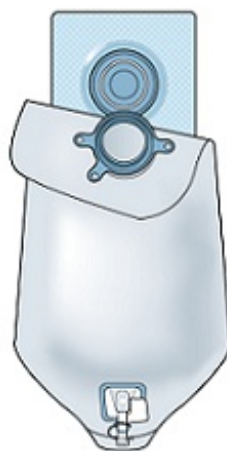
Рисунок 2. Присоединение стомного мешка к клеевой пластине двухкомпонентной мочеприемной системы