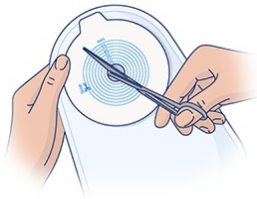
Рисунок 5. Отрезание клеевой пластины в однокомпонентной мочеприемной системе