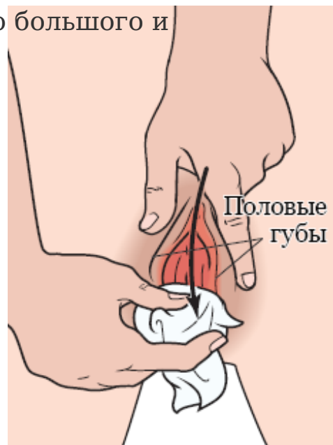
Рисунок 1. Очистка области между половых губ

8. Не переставая мочиться и держа половые губы в разведенном положении, помочитесь в контейнер так, чтобы он заполнился наполовину (см. рисунок 3). После чего закончите мочиться в унитаз или кресло-туалет.