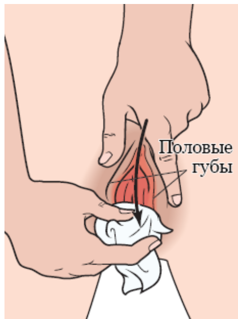
Рисунок 1. Очистка области между половых губ