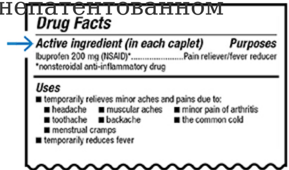
Рисунок 1. Информация о действующих веществах на этикетке безрецептурного препарата