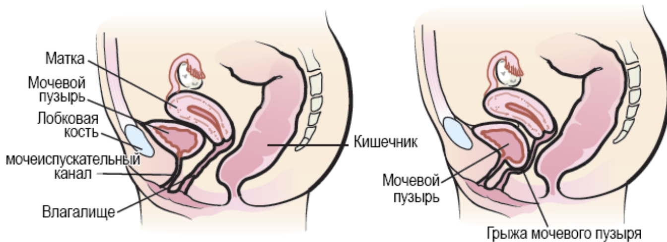
Рисунок 1. Внутренние органы женщины с грыжей мочевого пузыря (справа) и без нее (слева)

Грыжа мочевого пузыря может быть вызвана: