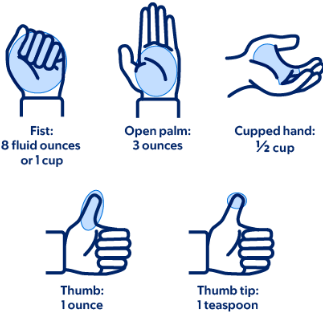
Рисунок 4. Как измерить размер порции рукой