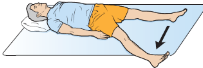
Рисунок 5. Укрепление отводящей мышцы