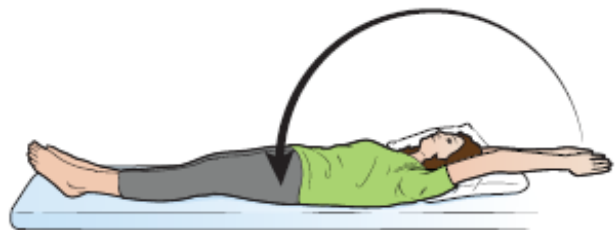
Рисунок 11. Растяжка над головой