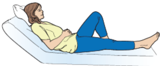
Рисунок 6. Сгибание ноги