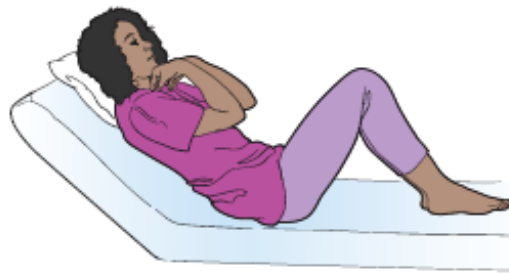
Рисунок 9. Касание плеч