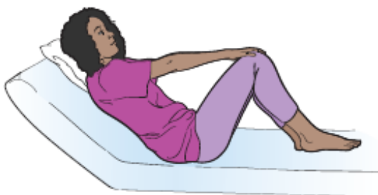
Рисунок 8. Вытягивание рук