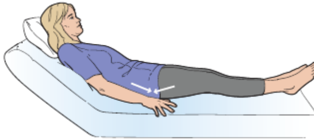
Рисунок 4. Сжатие ягодичных мышц