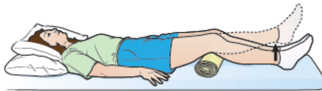
Рисунок 2. Упражнение на квадрицепс бедра с неполной амплитудой