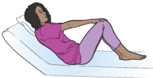
Рисунок 8. Вытягивание рук