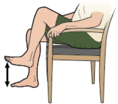
Рисунок 15. Ходьба на месте