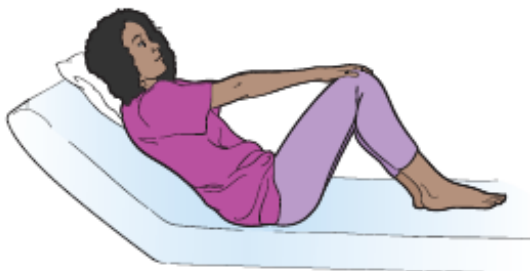
Рисунок 8. Вытягивание рук