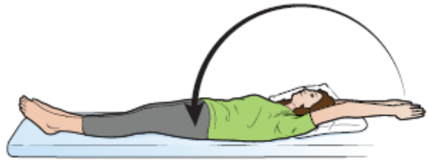
Рисунок 11. Растяжка над головой