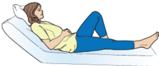
Рисунок 6. Сгибание ноги