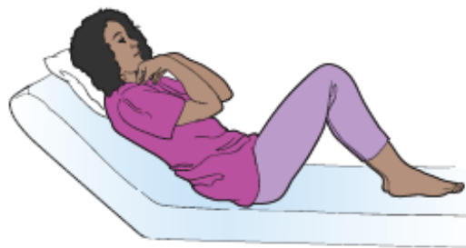
Рисунок 9. Касание плеч