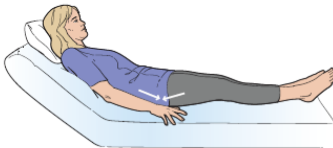
Рисунок 4. Сжатие ягодичных мышц