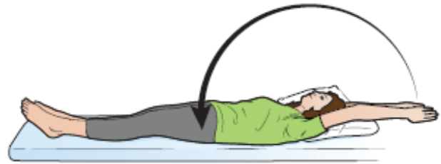
Рисунок 11. Растяжка над головой