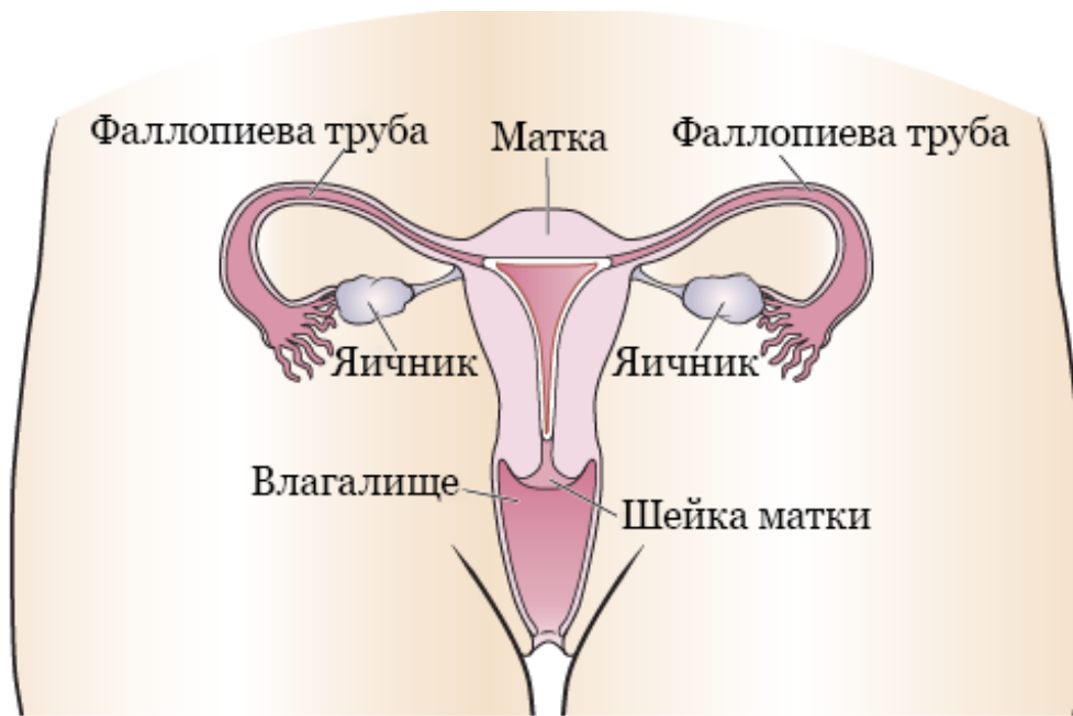
Рисунок 1. Женская репродуктивная система (вид спереди)

матки соединены яичники и фаллопиевы трубы.