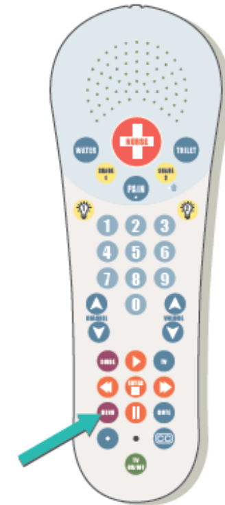
Рисунок 2. Кнопка «Меню» на пульте управления

Чтобы ответить на видеозвонок, нажмите кнопку «Меню» на пульте управления (см. рисунок 2). Вы увидите звонящего на экране телевизора и услышите его через динамик на пульте управления. Звонящий также сможет видеть и слышать вас. Вы можете поговорить с ним как обычно.