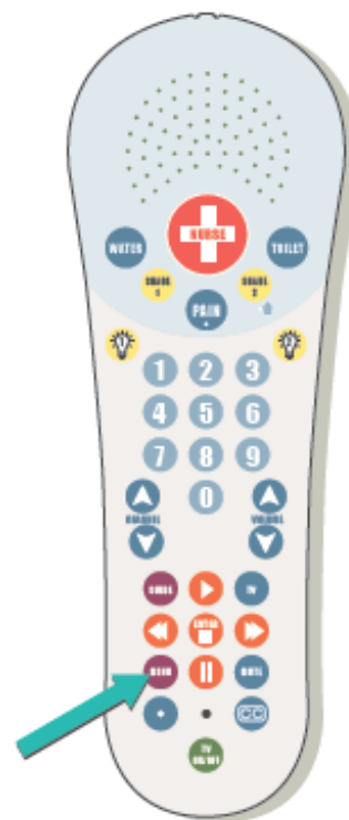
Рисунок 2. Кнопка «Меню» на пульте управления

Чтобы ответить на видеозвонок, нажмите кнопку «Меню» на пульте управления (см. рисунок 2). Вы увидите звонящего на экране телевизора и услышите его через динамик на пульте управления. Звонящий также сможет видеть и слышать вас. Вы можете поговорить с ним как обычно.