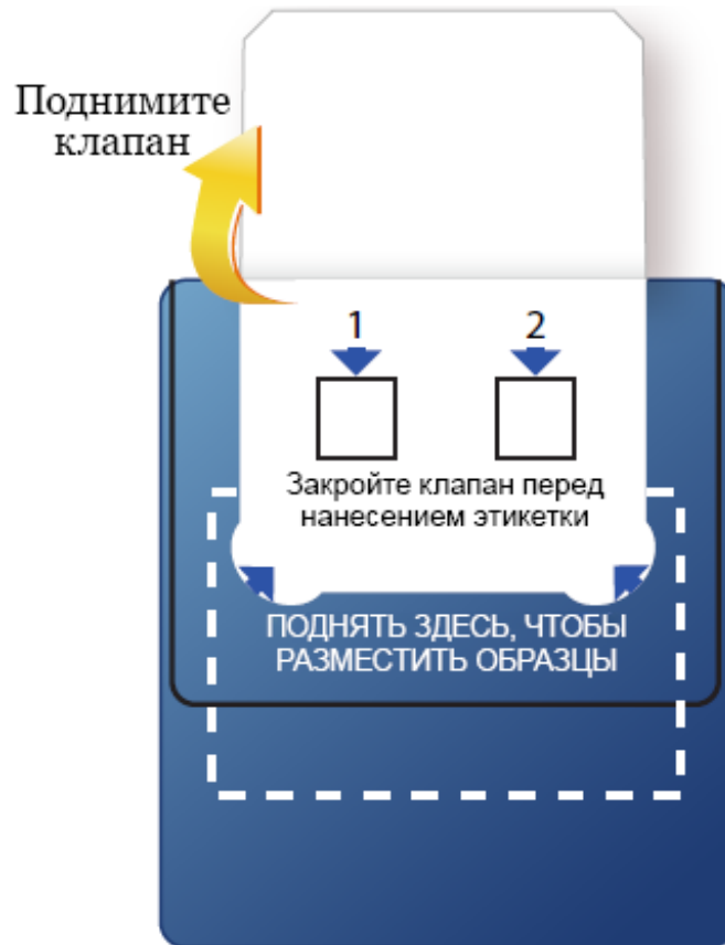
Рисунок 1. Поднимите клапан диагностической карты.

Чтобы взять образец стула и провести FIT, выполните описанные ниже действия.