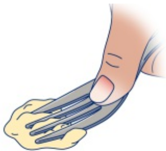
Рисунок 3. Проверка надавливанием вилкой

Положите вилку на продукт. Большим пальцем надавите на вилку (см. рисунок 3). Ваш продукт является достаточно мягким, если он полностью раздавлен и не возвращается в исходную форму.