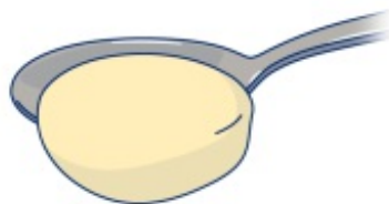
Рисунок 2. Наклонный тест с помощью ложки

Он должен легко соскальзывать с ложки, почти не оставаясь на ней (см. рисунок 2). Допускается слегка ударить ложкой, чтобы продукт упал на тарелку. Ваш продукт слишком густой, если он прилипает к ложке или не падает с наклоненной ложки.