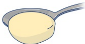
Рисунок 2. Наклонный тест с помощью ложки

Он должен легко соскальзывать с ложки, почти не оставаясь на ней (см. рисунок 2). Допускается слегка ударить ложкой, чтобы продукт упал на тарелку. Ваш продукт слишком густой, если он прилипает к ложке или не падает с наклоненной ложки.