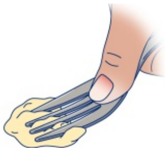
Рисунок 3. Проверка надавливанием вилкой

Положите вилку на продукт. Большим пальцем надавите на вилку (см. рисунок 3). Ваш продукт является достаточно мягким, если он полностью раздавлен и не возвращается в исходную форму.