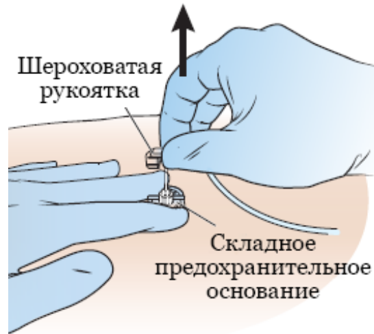
Рисунок 1. Поднятие шероховатой рукоятки

16. Сильно потяните шероховатую рукоятку (или крылышки иглы порта) вверх, пока не почувствуете плотный упор, щелчок или и то, и другое (см. рисунок 1). Это означает, что игла зафиксирована в безопасном положении (см. рисунок 2).