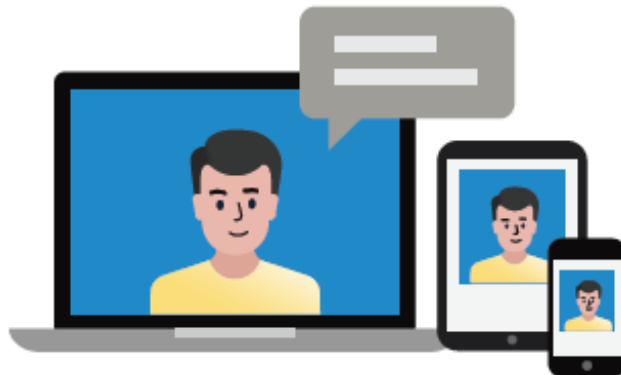
Рисунок 4. Видеозвонок с вашего компьютера или смарт-устройства

If you have questions or concerns, contact your healthcare provider. A member of your care team will answer Monday through Friday from 9 a.m. to 5 p.m. Outside those hours, you can leave a message or talk with another MSK provider. There is always a doctor or nurse on call. If you're not sure how to reach your healthcare provider, call 212-639-2000.