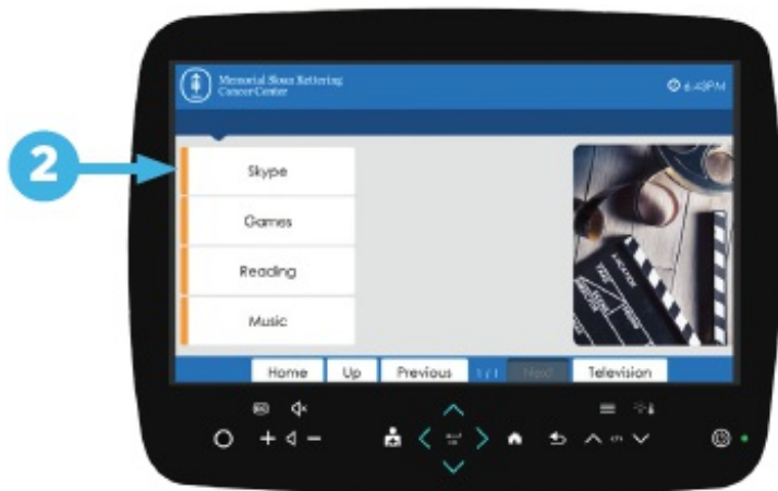
Рисунок 2. Выберите «Skype»

И вам, и тому человеку, с которым вы будете общаться, необходимо иметь учетную запись в приложении Skype. Вы можете создать ее бесплатно.