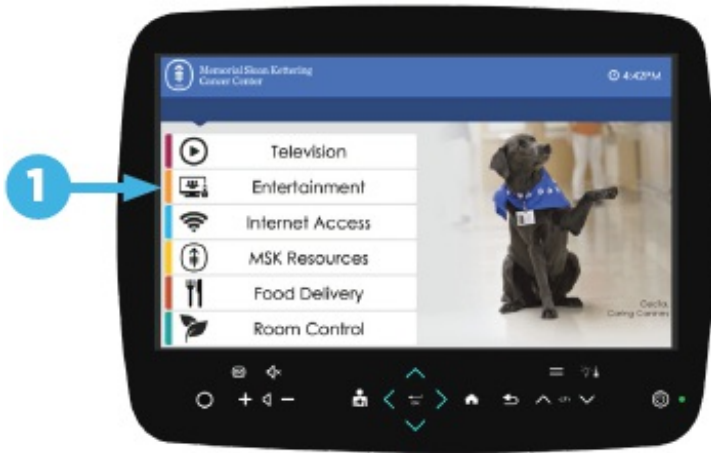
Рисунок 1. Выберите пункт «Развлечения» (Entertainment)

(Entertainment), а затем «Skype» (см. рисунки 1 и 2).