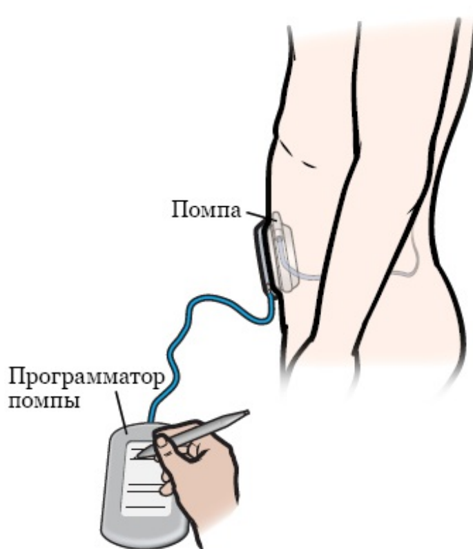
Рисунок 2. Программирование помпы

Во время приема врач по обезболиванию вызовет онемение кожи, чтобы вы не чувствовали боли. Затем через кожу вам введут иглу в помпу. Врач извлечет лекарство, которое осталось в вашей помпе, и введет в