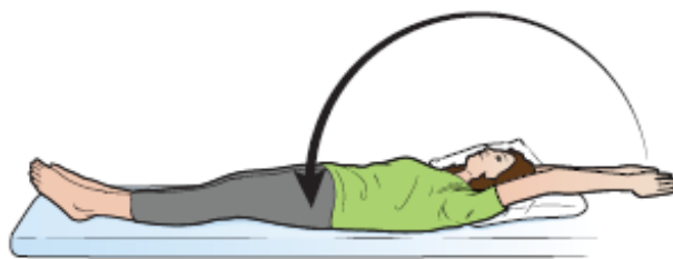
Рисунок 7. Руки над головой