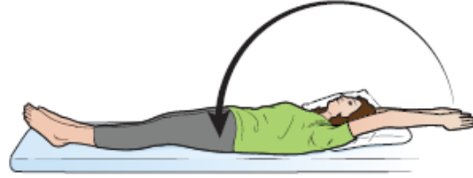
Рисунок 7. Руки над головой