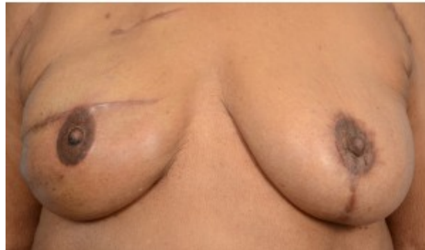
3D-татуаж: правосторонняя реконструкция с использованием имплантата

If you have questions or concerns, contact your healthcare provider. A member of your care team will answer Monday through Friday from 9 a.m. to 5 p.m. Outside those hours, you can leave a message or talk with another MSK provider. There is always a doctor or nurse on call. If you're not sure how to reach your healthcare provider, call 212-639-2000.