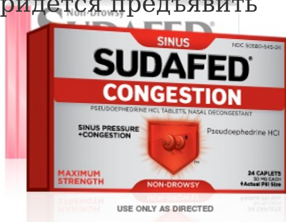
Рисунок 4. Псевдоэфедрина гидрохлорид

При наличии полной эрекции в пенис не поступает