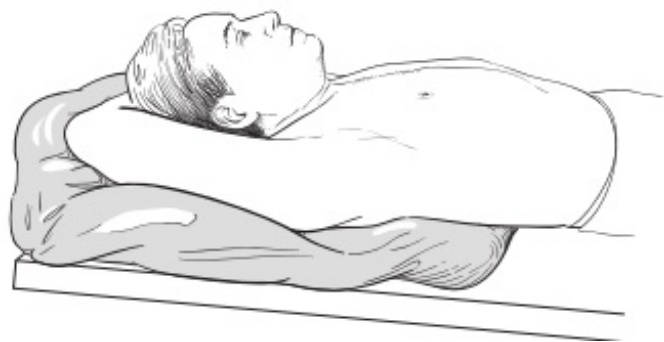
Рисунок 1. Размещение в слепке

Во время процедуры моделирования вы скорее всего будете лежать на спине. Когда вы будете лежать на столе, с верхней части тела вам сделают слепок. Радиотерапевты нальют теплую жидкость в большой пластиковый пакет, который будет герметично закрыт и размещен на столе. Вы ляжете поверх пакета на