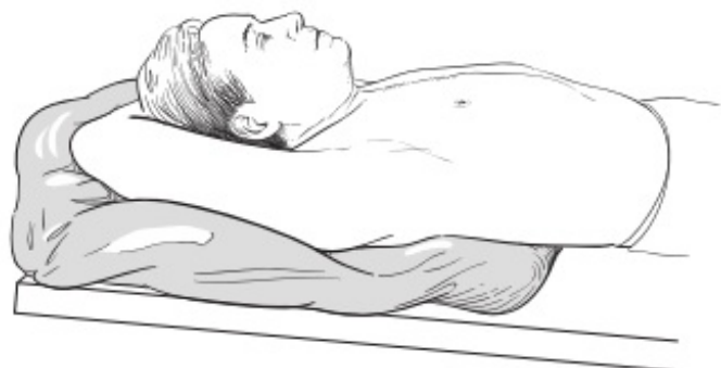
Рисунок 1. Размещение в слепке

Во время процедуры моделирования вы скорее всего будете лежать на спине. Когда вы будете лежать на столе, с верхней части тела вам сделают слепок. Радиотерапевты нальют теплую жидкость в большой пластиковый пакет, который будет герметично закрыт и размещен на столе. Вы ляжете поверх пакета на