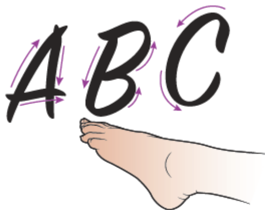
Рисунок 3. Алфавит для щиколотки