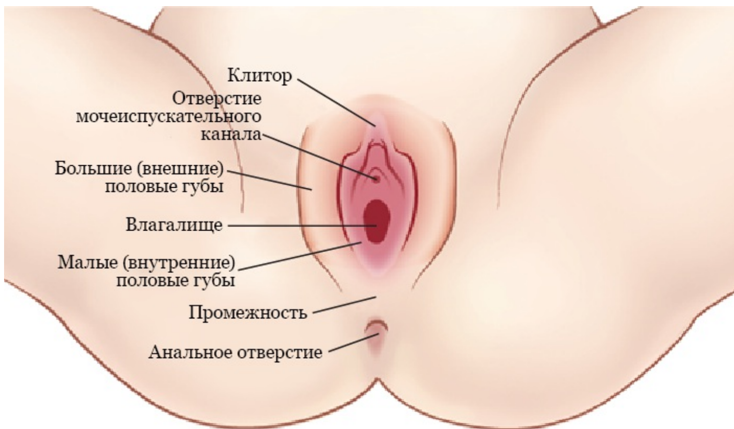
Рисунок 1. Вульва