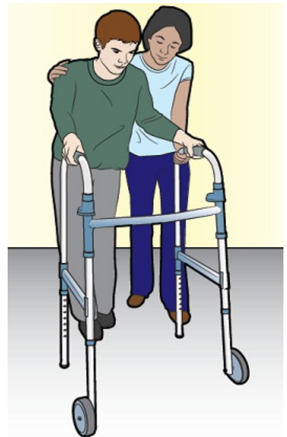
Рисунок 2. Работа с физиотерапевтом