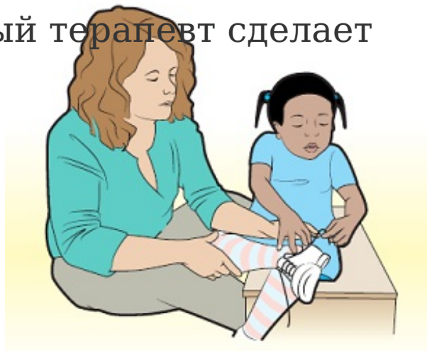
Рисунок 1. Работа с реабилитационным терапевтом