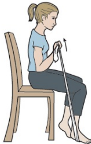
Рисунок 3. Потяните ленту вверх