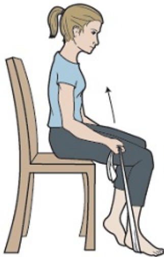
Рисунок 2. Прижмите эластичную ленту ступней