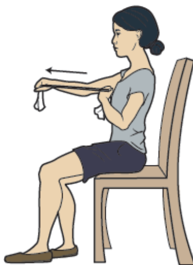
Рисунок 1. Удары руками перед собой