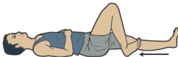
Рисунок 6. Скольжение пятками