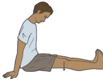
Рисунок 3. Сжатие квадрицепсов