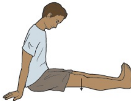
Рисунок 3. Сжатие квадрицепсов