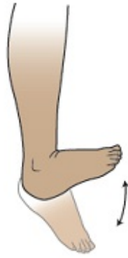
Рисунок 2. Покачивания стопой