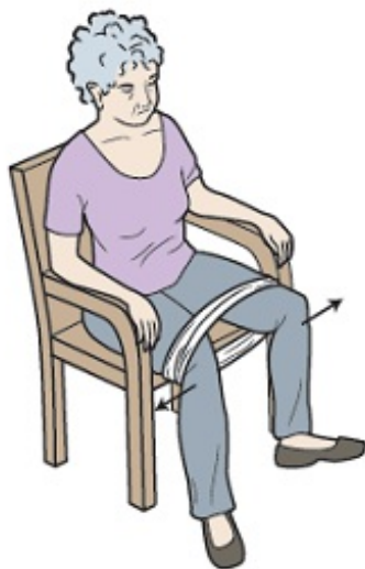
Рисунок 7. Укрепление отводящей мышцы в положении сидя с помощью эластичной ленты