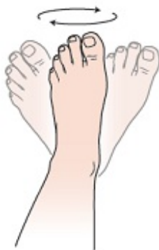
Рисунок 1. Вращение стопой