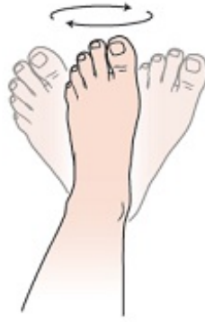
Рисунок 1. Вращение стопой