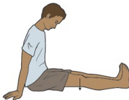
Рисунок 3. Сжатие квадрицепсов