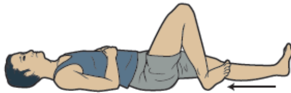
Рисунок 6. Скольжение пятками