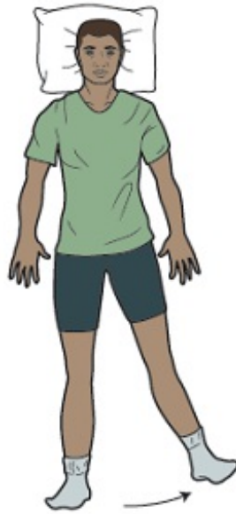
Рисунок 5. Упражнение на укрепление отводящей мышцы