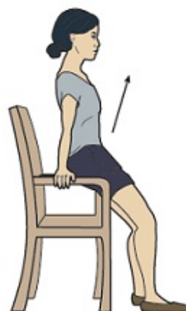
Рисунок 10. Приподымание со стула с опиранием на подлокотники