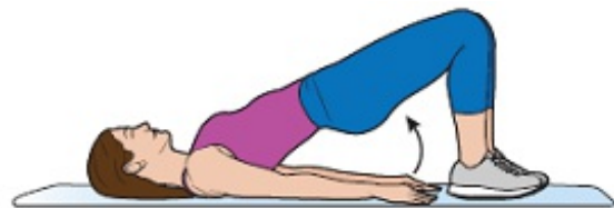
Рисунок 8. Поднятие ягодиц