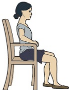
Рисунок 9. Положение сидя с прямой спиной