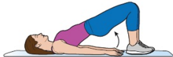
Рисунок 8. Поднятие ягодиц