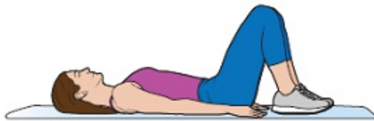
Рисунок 7. Положение лежа на спине с согнутыми в коленях ногами