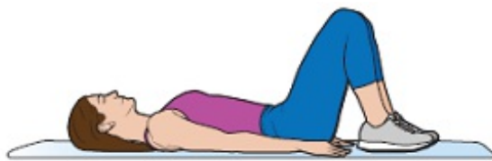
Рисунок 7. Положение лежа на спине с согнутыми в коленях ногами