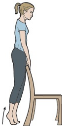
Рисунок 6. Подъем пяток