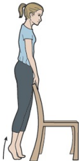
Рисунок 6. Подъем пяток