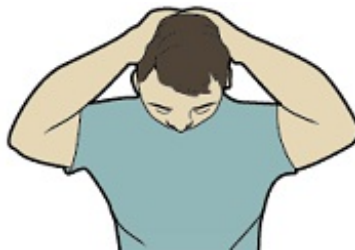
Рисунок 1. Растяжка задней поверхности шеи