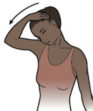
Рисунок 4. Прижмите подбородок к груди