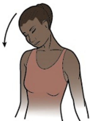
Рисунок 2. Наклоните ухо к плечу