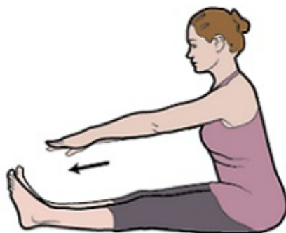
Рисунок 7. Растяжка мышц задней поверхности бедра