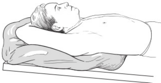
Рисунок 1. Слепок тела

Чтобы изготовить фиксирующее приспособление, радиотерапевты нальют теплую жидкость в большой пластиковый пакет. Они герметически закроют пакет и положат его на стол. Вы будете лежать спиной на этом пакете. В большинстве случаев пациентов просят поднять руки к голове (см. рис. 1). Если вам нужно будет опустить руки, врачи обсудят это с вами.