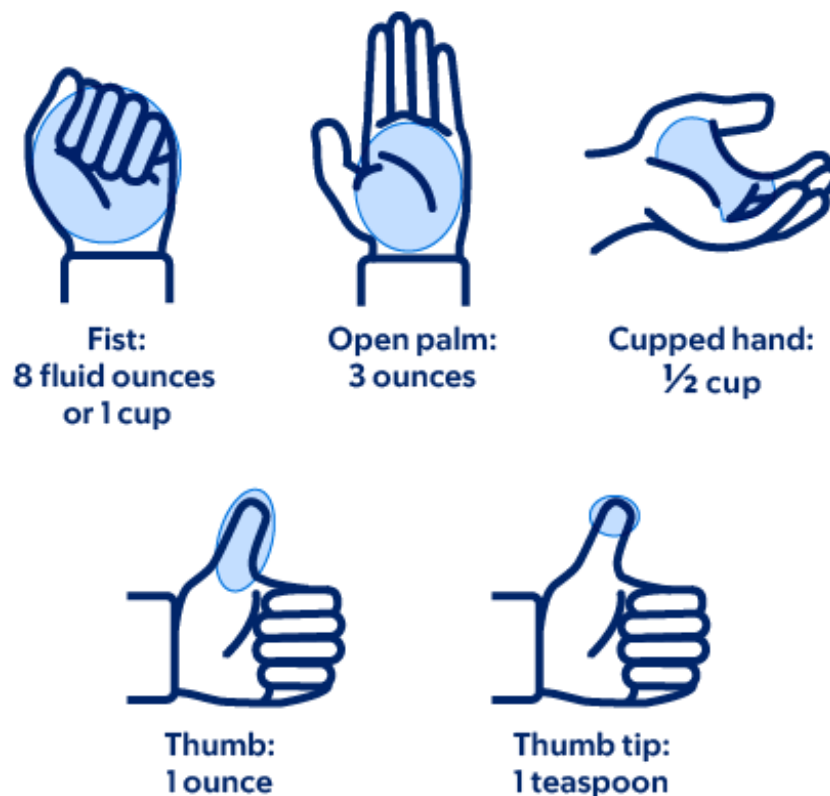
Figura 4. Si ta matni madhësinë e racionit me dorë

Për të matur ushqimet, përdorni lugë matëse, gota matëse ose peshore. Gjithashtu mund të përdorni udhëzimet në Figurën 4 për të përlogaritur sasi të disa ushqimeve.