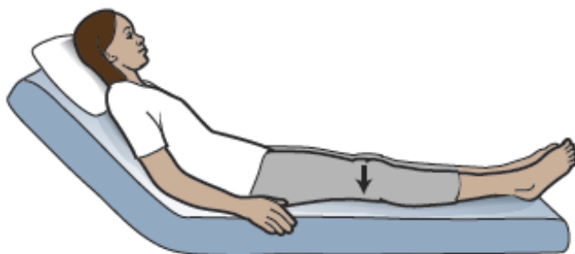
图 2. 股四头肌动作组