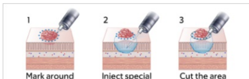
图 2 显示了肿瘤切除过程。手术通常需要 1 至 3 小时，但有时可能会更长。

医生会利用空气和液体让窥镜沿着整个结肠移动，同时在视频显示器上观察异常情况。然后医生会使用窥镜将肿瘤切除，再将该区域缝合（如有需要）。完成后，他们会将窥镜取出。