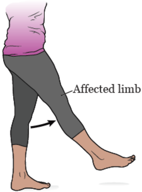
图 2. 屈髌