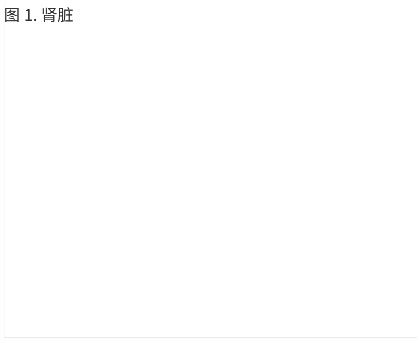
图 1. 肾脏