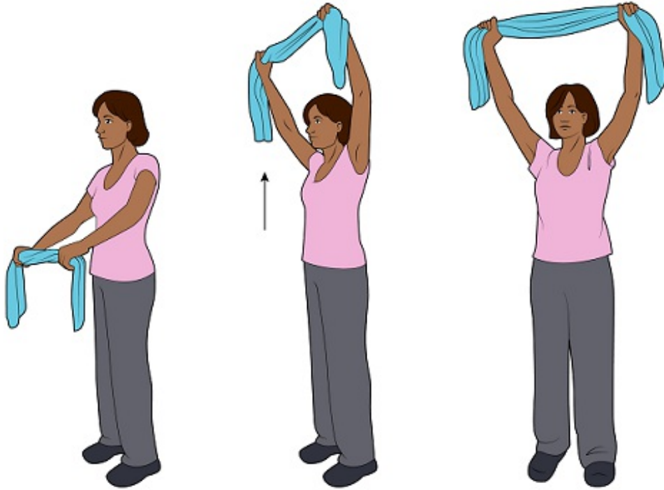
图 3. 向上伸展