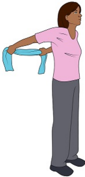
图 4. 向后伸展