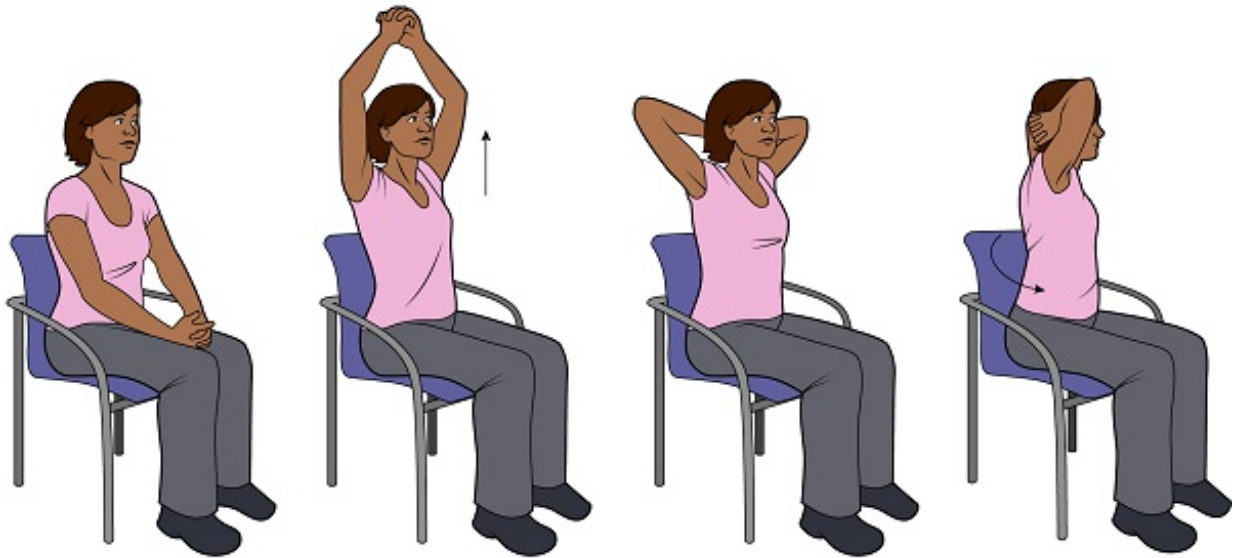
图 2. 腋下伸展